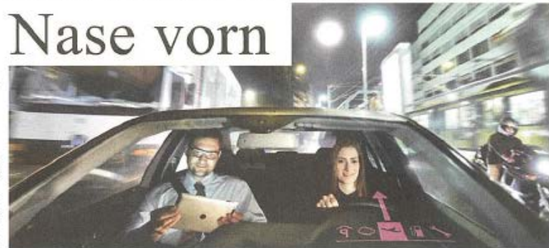
Die rheinischen Metropolen sind auch digital bestens vernetzt.

Viele Konzepte werden dann mit Hilfe von Vodafone, der Telekom oder ganz klassisch mit der Bank als Kapitalgeber auf den Markt gebracht. Ob es um die Rabattjagd geht (Coupiés), das mobile Bezahlen (Sumup), moderne Car-sharing-Konzepte (Tamyca) oder Entwicklung für Smart-